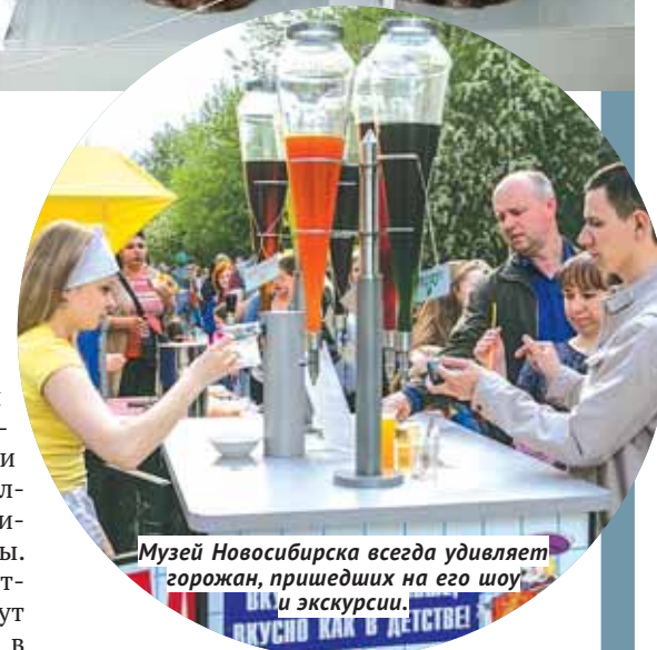
Музей Новосибирска всегда удивляет горожан, пришедших на его шоу и экскурсии.