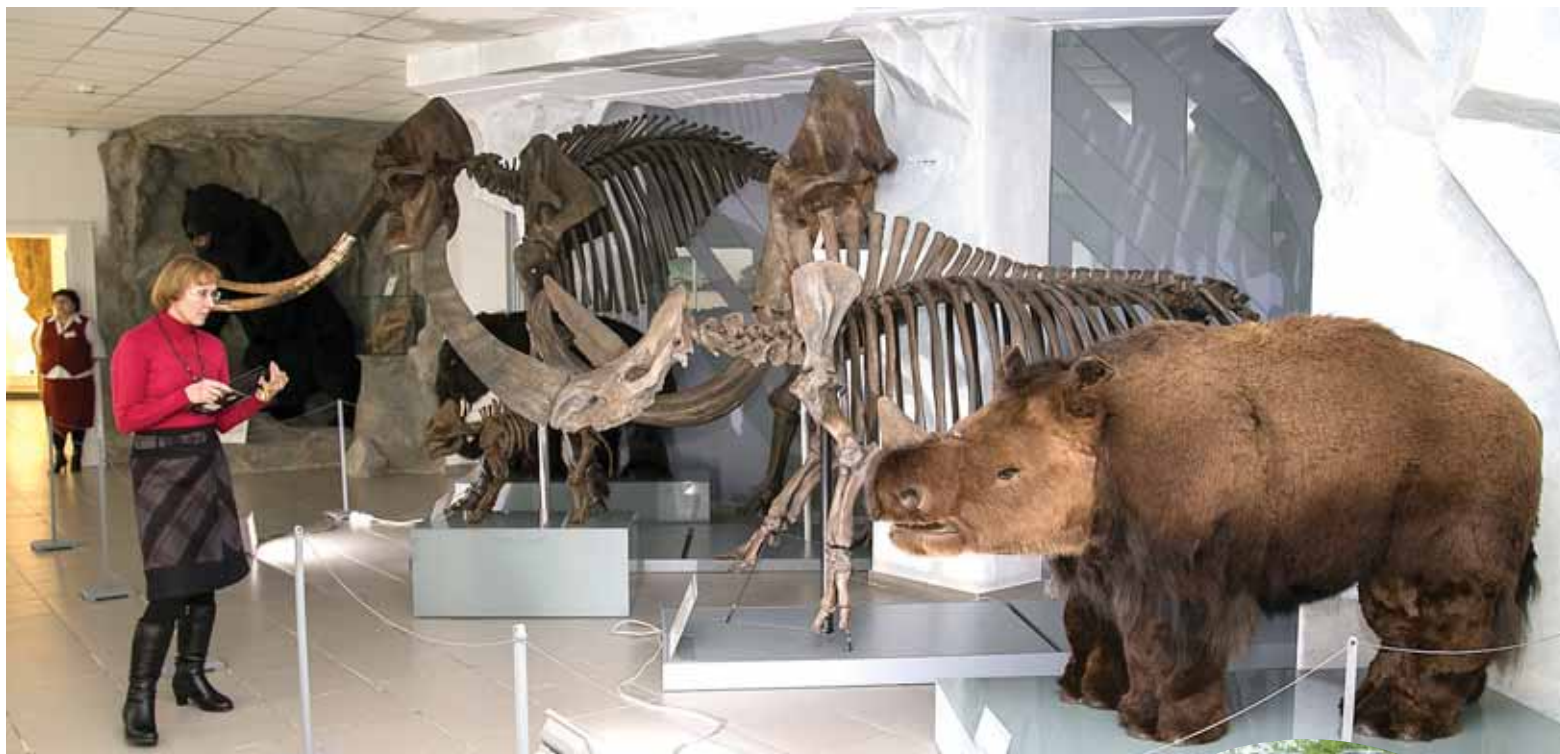
Музей природы подготовил для «Ночи» особенную программу.

Более 270 предприятий Новосибирской области проверили на безопасность пищевой продукции. Итоги подвели на очередном заседании комиссии при министерстве промышленности НСО. Специалисты уполномоченных органов проверяли безопасность при производстве, хранении и реализации хлебобулочных и кондитерских изделий, муки, продуктов для детского питания, крупы, а также БА-Дов. По итогам проверок составлено 139 протоколов, снято с реализации 139 партий хлебобулочных и кондитерских изделий общим весом 369 кг, утилизировано 459 кг крупы, возвращено поставщикам 281,02 тонны крупы. Управлением Россельхознадзора выявлено 8,67 тонны крупы, не соответствующей нормативам. По вопросам качества пищевых продуктов действует горячая линия 8-800-350-50-60.