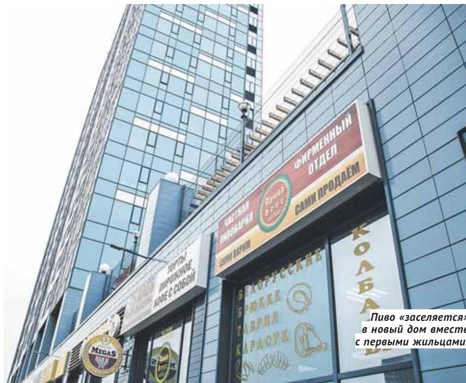
Пиво «заселяется» в новый дом вместе с первыми жильцами.

По данным Центра исследований федерального и регионального рынков алкоголя, 85% торговых точек, торгующих спиртным, в том числе и пивом, приходится на магазины в жилых домах. И Новосибирск по числу таких пивных впереди планеты всей — у нас что ни пивнушка, то обязательно на первом этаже жилого дома. И зачастую — круглосуточная, работающая в формате «бар-кафе». Понятное дело, что такое соседство жильцам не по нраву и время от времени они локально «бунтуют». К сожалению, правительство РФ не поддержало законопроект, запрещающий торговлю спиртным в жилых домах, мотивируя это тем, что «зако-