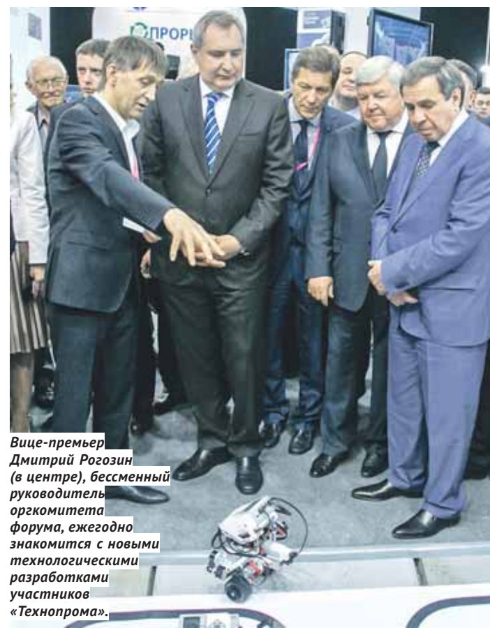
Вице-премьер Дмитрий Рогозин (в центре), бессменный руководитель оргкомитета форума, ежегодно знакомится с новыми технологическими разработками участников «Технопрома».

Среди новшеств «Технопрома-2017» — то, что один день, 20 июня, будет отведён молодёжным образовательным программам. В его мероприятиях примут участие студенты вузов, молодые предприниматели, представители научной общности.