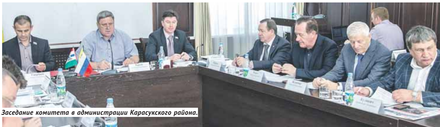
Заседание комитета в администрации Карасукского района.

В районе хорошо поставлено образование, есть гимназия и лицей, даю-